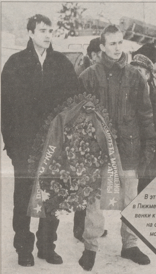
В этот день в Пижме возложили венки к памятнику на свежей могиле.

Воскресенье, 26 января, на Пижменском кладбище проходил траурный митинг, посвященный 53-й годовщине освобождения Гатчины. Был он не похож на все остальные: в этот день в Пижме возложили венки к новому памятнику советским воинам на свежей могиле. Это были опоздавшие на 55 лет похороны солдат, офицеров и мирных жителей Гатчины, погибших в октябре 1941 года на подступах к нашему городу.